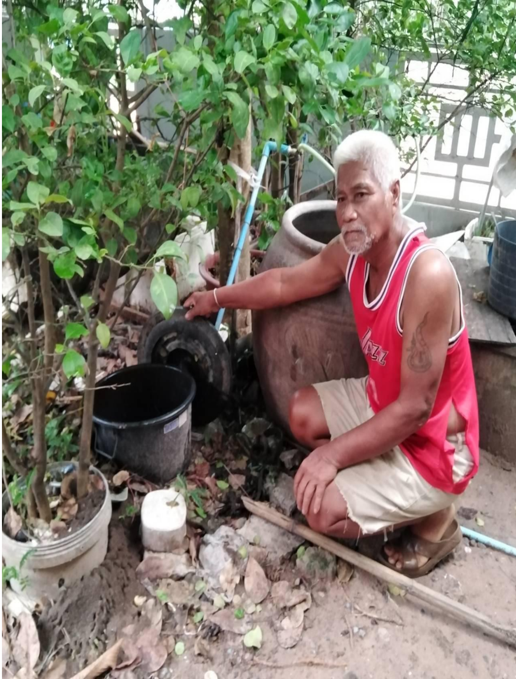
นายอำเภอ เมืองสองชั้น บ้านเลขที่ 35 ม.5 ต.นาใหญ่ อ.สุวรรณภูมิ จ.ร้อยเอ็ด