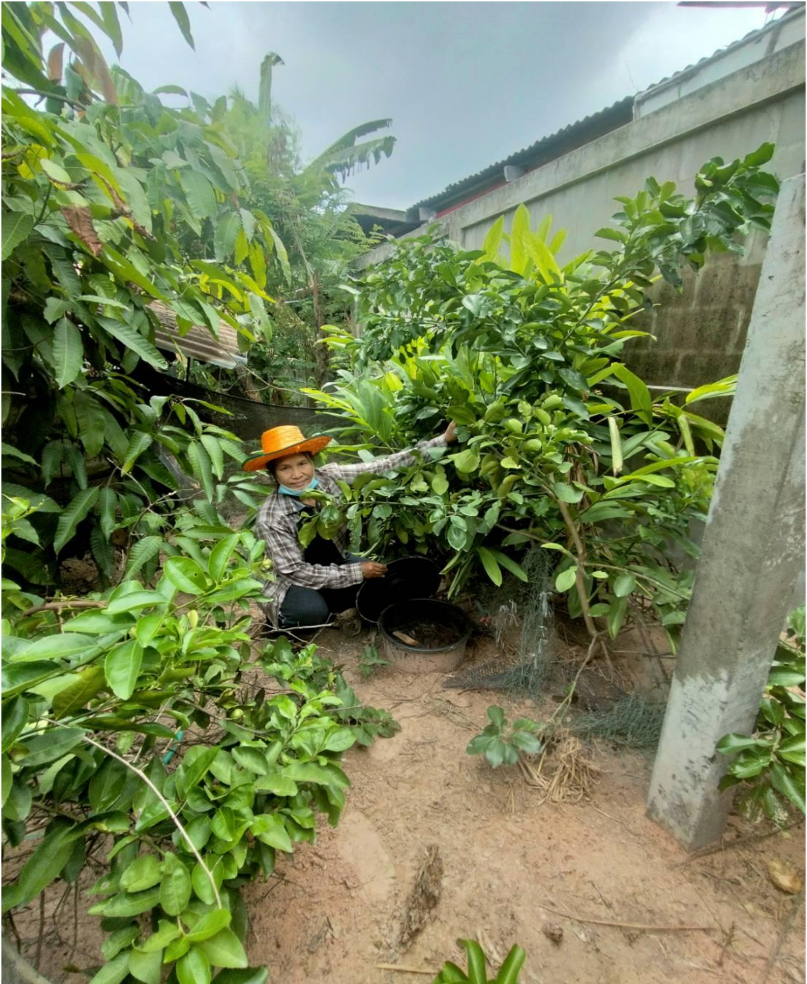
นางสาววัชรพร อ้วนสูงยาง บ้านเลขที่ 488 ม.1 ต.นาใหญ่ อ.สุวรรณภูมิ จ.ร้อยเอ็ด